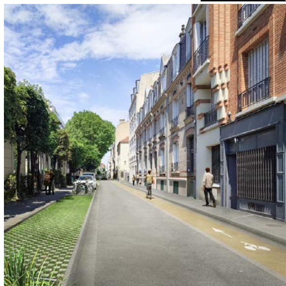
Rue de Strasbourg

La rue de Montreuil, entre la rue de Fontenay et l'avenue de la République, a été aménagée en zone de rencontre : vitesse limitée à 20 km/h, priorité aux piétons, bordures de trottoir à niveau pour faciliter la traversée des piétons. Un double sens cyclable et deux aires de livraison ont été créés.