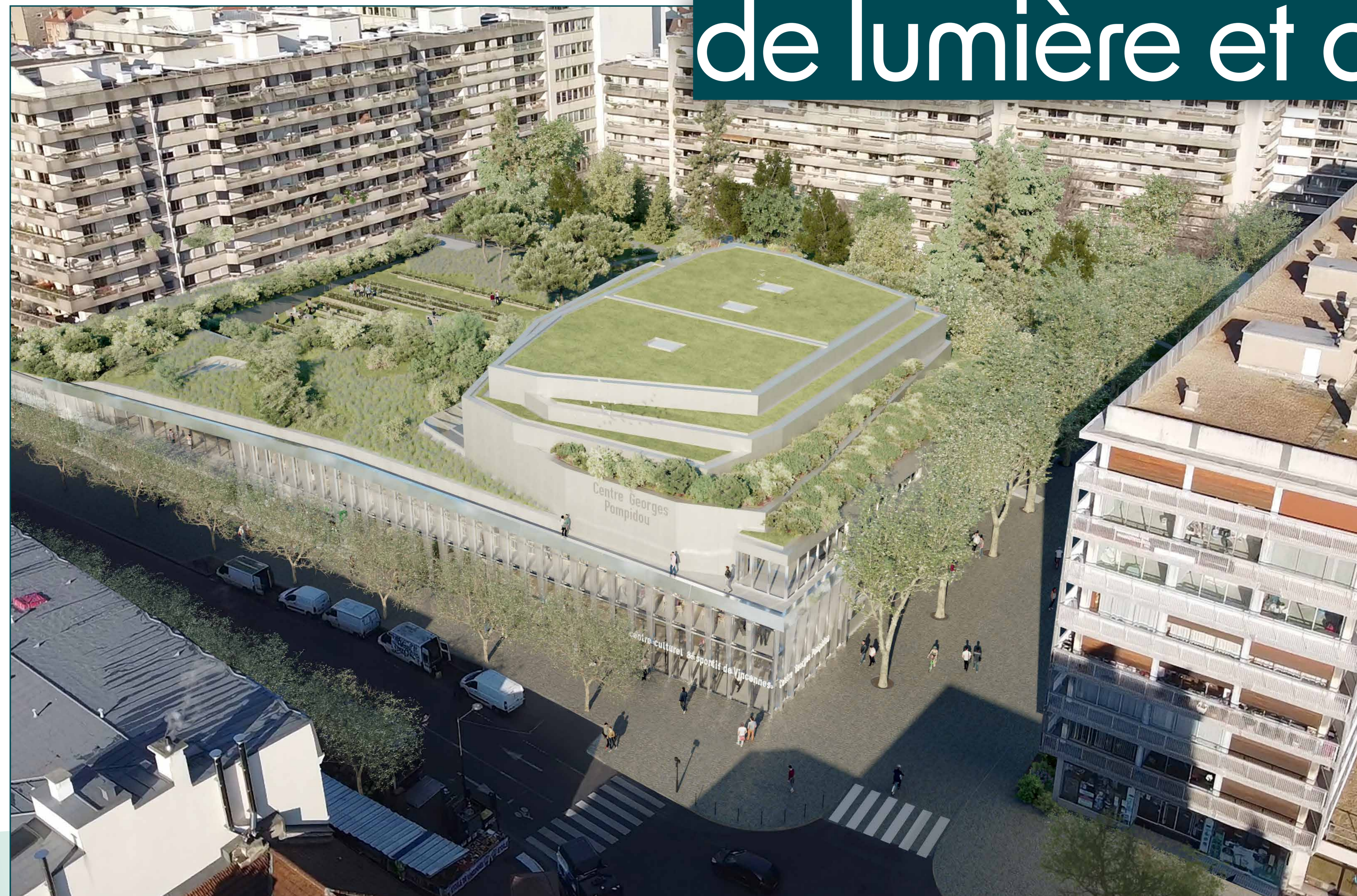
Projet © AJC / Perspective © morph

Un volume découpé pour plus de lumière et de légèreté,