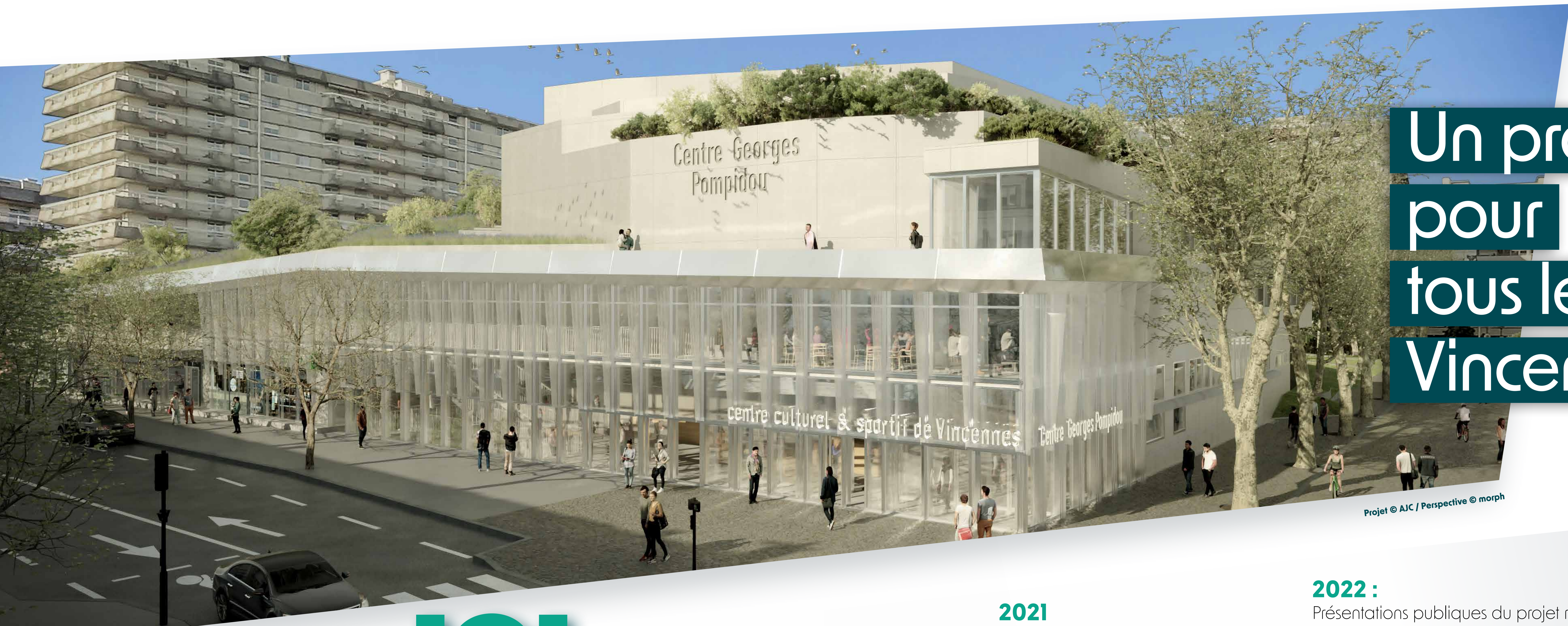
Projet © AJC / Perspective © morph

ICI, la ville investit pour préparer l'avenir